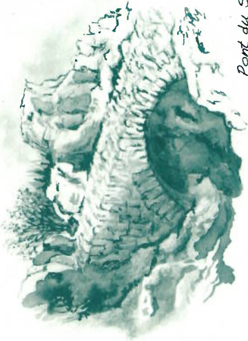
Pont du Soucy

Résumer ici ce que fut la guerre des religions entamée par les réformes de Luther et Calvin au XVIe s. et achevée par le concordat de 1801 de Bonaparte serait présomptueux. Pour mémoire, les périodes clés restent août 1572 massacre de la Saint Barthélémy, Avril 1598 promulgation de l'Edit de Nantes sous Henri IV mettant fin aux guerres de religion, juin 1629 l'Edit de grâce d'Alès sous le règne de Louis XIII n'autorise plus les protestants à conserver leurs places fortes militaires, puis Louis XIV révoque l'Edit de Nantes en octobre 1685 interdisant la pratique religieuse protestante, près de 300.000 pratiquants s'exilèrent. En Cévennes, pays éminemment protestant, ce fut l'assassinat de l'abbé du Chaila le 24 juillet 1702 au Pont de Montvert qui signa le début de la révolte, la guerre des camisards de 1702 à 1705 (reddition des insurgés). 3000 protestants contre 30000 dragons fut le rapport de force de cette guérilla. En vallée Borgne, les habitants subissent tous des persécutions. Les pillages et les incendies succèdent aux massacres et aux déportations; Le 30 mars 1703, après le «brûlement» de Saumane, 265 de ses habitants sont déportés en terre catalane. Le Roi autorise le «brûlement des Cévennes». Un Peyroliais, du Mas de La Salle, Jean-Louis Mercoiret, combattant camisard finira pendu à Nîmes.