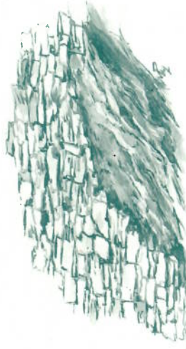
Mur de pierre sèche

Après le poteau "Rougeiresque", poursuivre vers la droite. Une fois passé le poteau indiquant "Chemin de Castanet", prendre direction de "Malataverne".