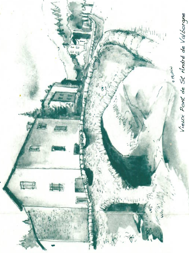
Vieux Pont de St André de Valborgne