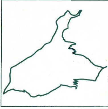
Boucle n° 6

Apparaissent les premiers habitats, des maisons traditionnelles entourées de potagers encore travaillés. L'occasion de saisir l'avancée du génie civil qui prévalait à l'époque en matière de gestion de l'eau : au moulin des Brousses, à la confluence du ruisseau de Nogaret et du Gardon, un aqueduc achemine l'eau vers l'aval ; on peut en suivre le parcours le long d'une prairie où des pierres de lauze servent de petits portillons ouvrant sur des béals (canaux d'irrigation) de plus en plus fins et filant jusqu'aux jardins.