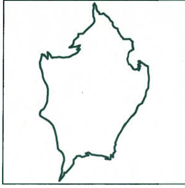
Boucle n° 8