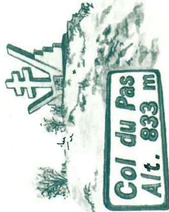
La croix du maquis

Le monument érigé à la mémoire des Résistants de la Seconde guerre mondiale a été entièrement financé et construit par les anciens du maquis. Il représente le point central des mouvements d'Aire-de-Côte, d'Ardailiers et de Lasalle, trois foyers de lutte qui forment le maquis Aigoual-Cévennes. Dominant les deux vallées Borgne et de l'Hérault, posée dans un site grandiose, cette croix bâtie au creux d'un grand « V » signalant la victoire est le « symbole d'une volonté farouche, de la résistance de tous les Cévenols à toute manifestation de fascisme, à toute tentative de privation de liberté. Elle est le symbole aussi des valeurs républicaines auxquelles tenaient tous ces maquisards prêts à combattre l'ennemi malgré leurs faibles moyens », peut-on lire dans un livret rédigé il y a quelques années par les anciens combattants à l'adresse des collégiens du département. Une plaque au revers de la croix exprime cette volonté de perpétuer le souvenir hors de toute autre considération : « Ni les discours ni les cérémonies n'ont fait la force de la Résistance ». D'autres endroits sont marqués par l'histoire des mouvements de résistance, de Saint Hippolyte du Fort à Saint André de Valborgne en passant par Lasalle et Soudorgues. Pour les connaître (la croix porte le n° 20 sur 23 lieux de mémoire recensés), le précieux livret, un petit document assorti d'une cartographie, signé par les anciens du maquis, est disponible chez le libraire Pascal Coularou, à Saint Hippolyte du Fort.